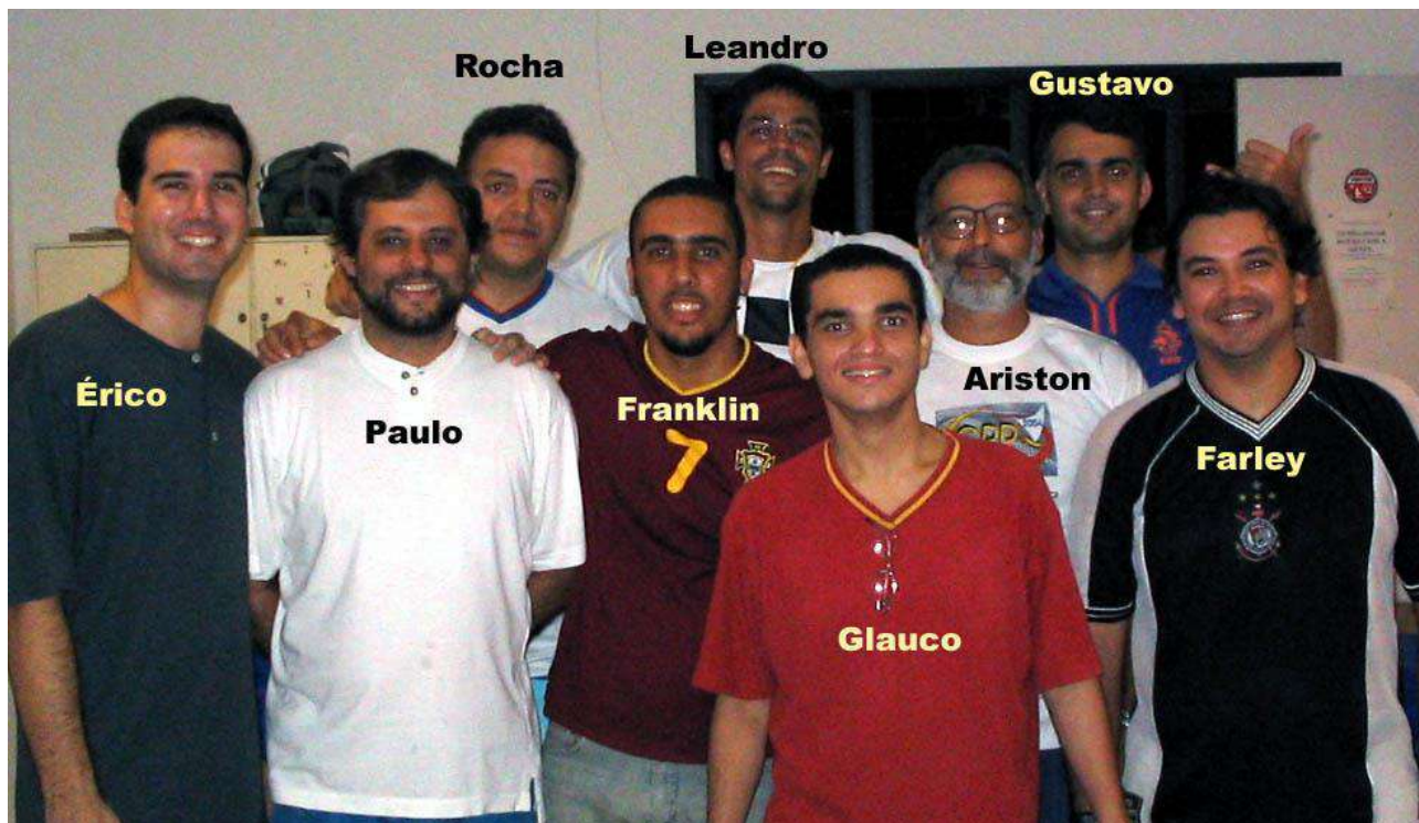
Botonistas da AFFUME