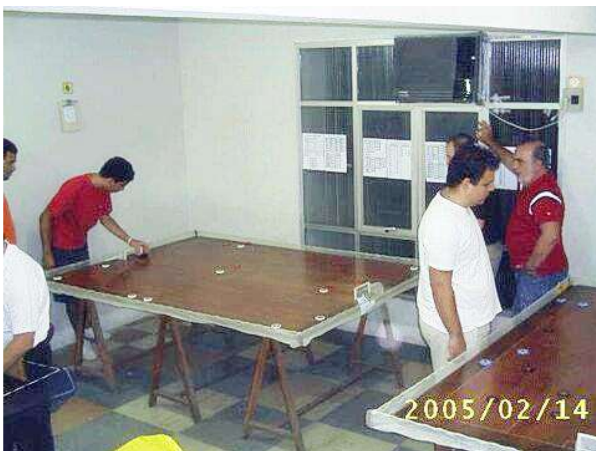
Sede da ABC