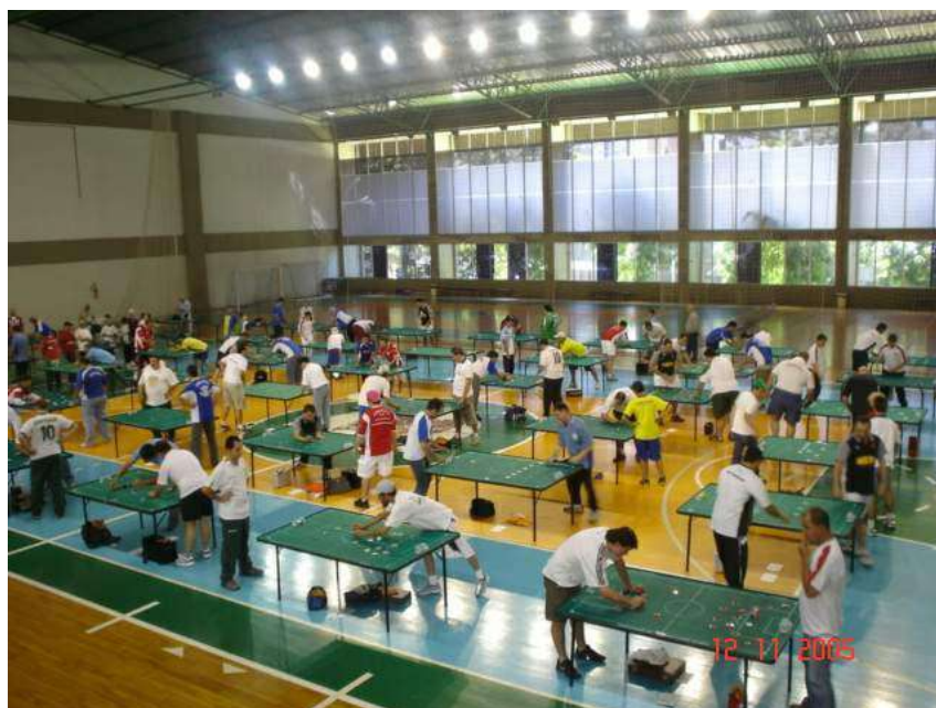
Clube Curitibano, Curitiba (PR)