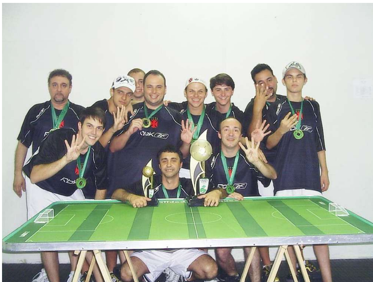
C. R. Vasco da Gama

Quem foi a sede da AABB-Tijuca no dia 14 de dezembro de 2008 pôde ver mais um confronto inesquecível entre América e Vasco da Gama. Se não bastasse as duas equipes estarem disputando o título do Campeonato Estadual, os atletas envolvidos na decisão promoveram jogos espetaculares onde sentimentos como a emoção, o nervosismo e a ansiedade tomaram conta não só daqueles que estavam nas mesas como também do grande público que foi conferir de perto o talento de duas das melhores equipes do Brasil.