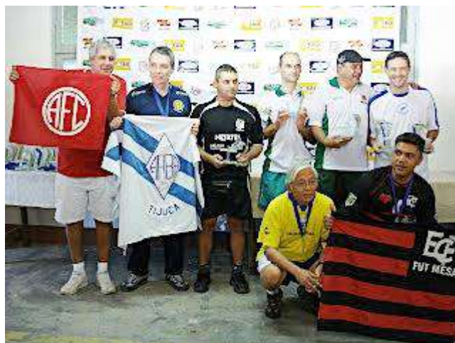
Master - Bronze