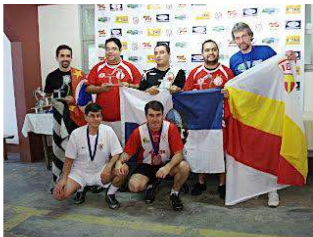
Adulto - Bronze