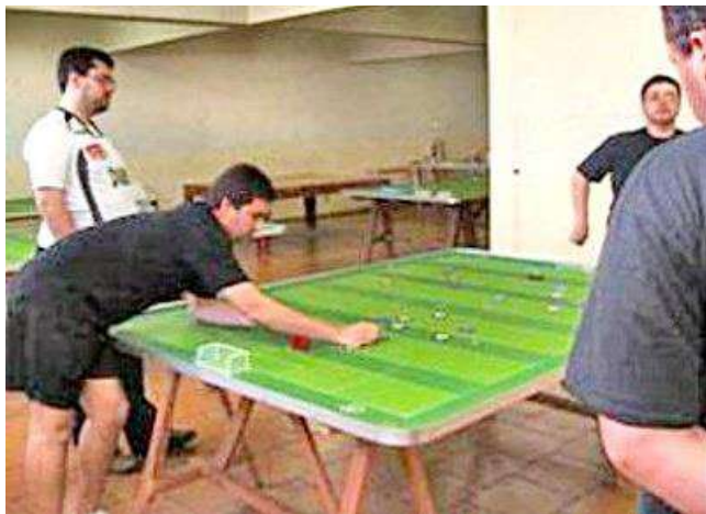
Lance da final