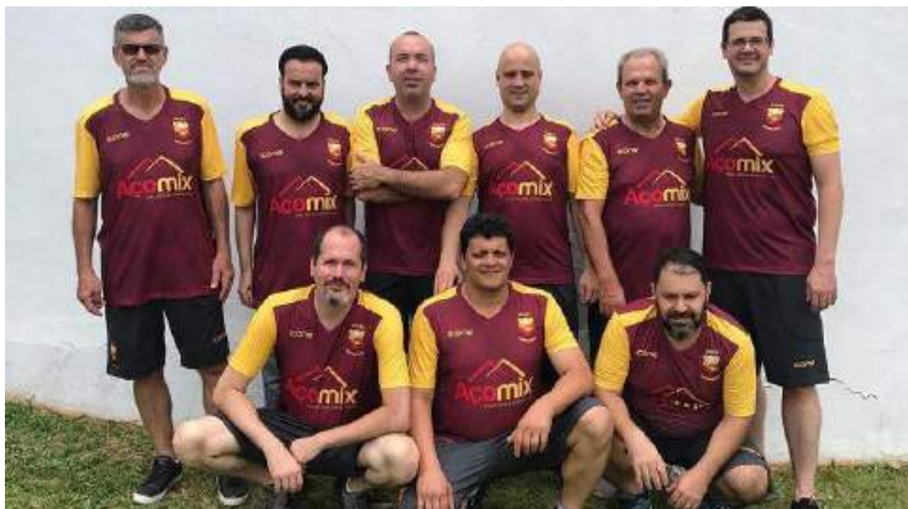
União Independente, de Bilac (SP)

Disputado em Brasília (DF), no período de 15 a 17 de novembro de 2019.