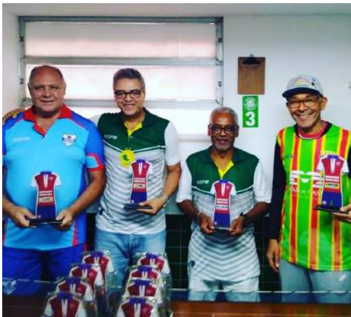
Os quatro finalistas do Estadual de Masters