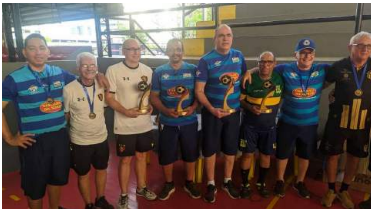
Os oito melhores da categoria Master