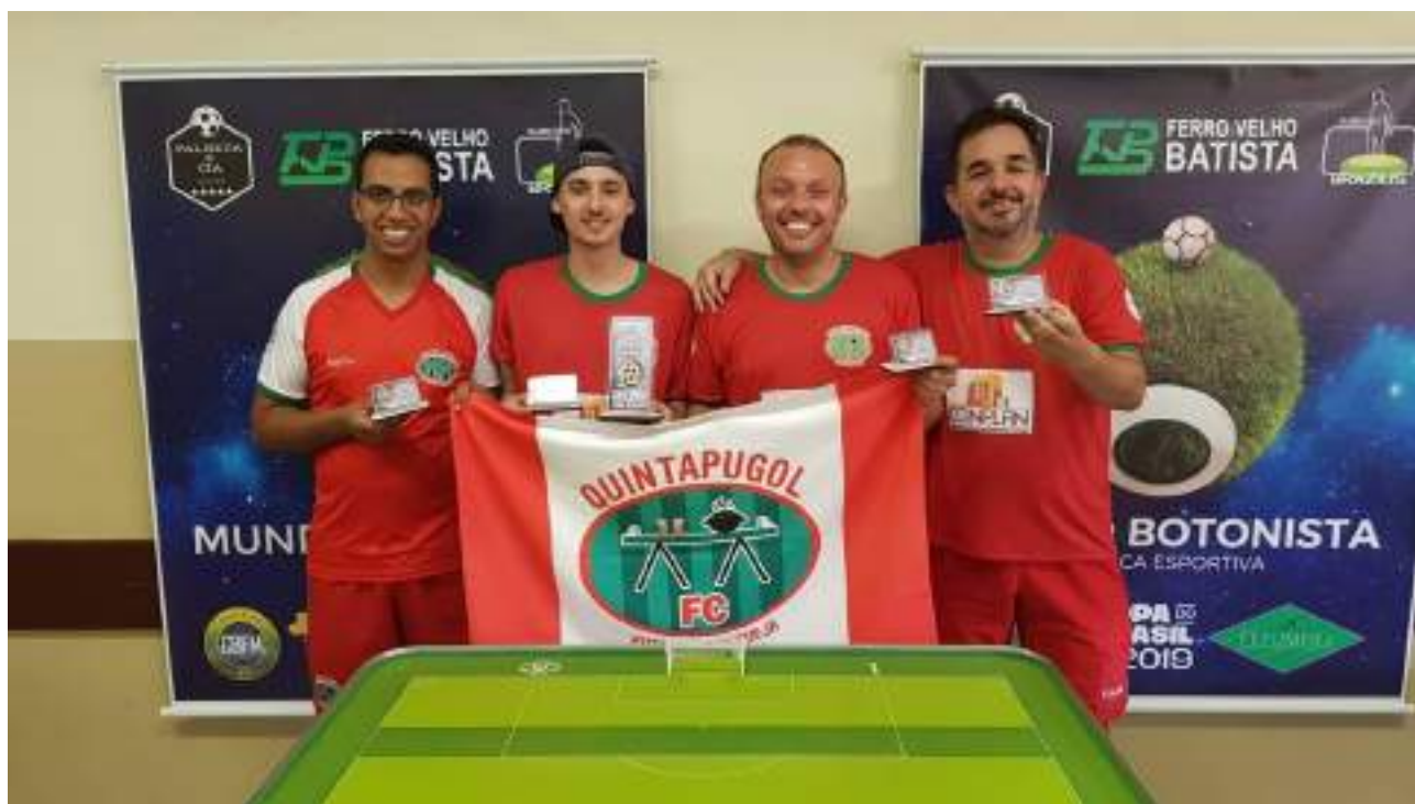
Quintapugol - Campeã Paranaense de Equipes