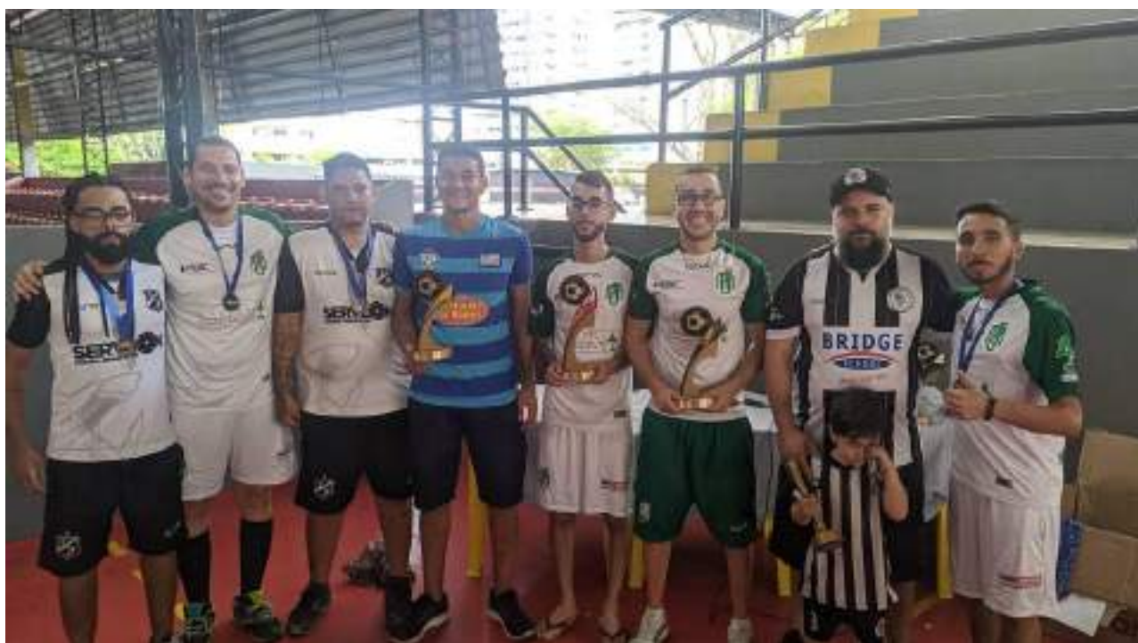
Os oito melhores da categoria Adulto