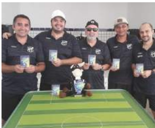
Equipe do Ceará