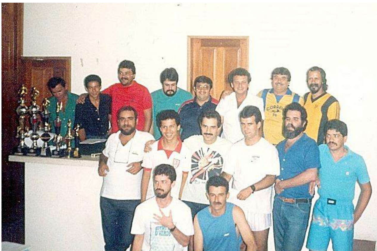
Alguns dos participantes do Campeonato Brasileiro Individual