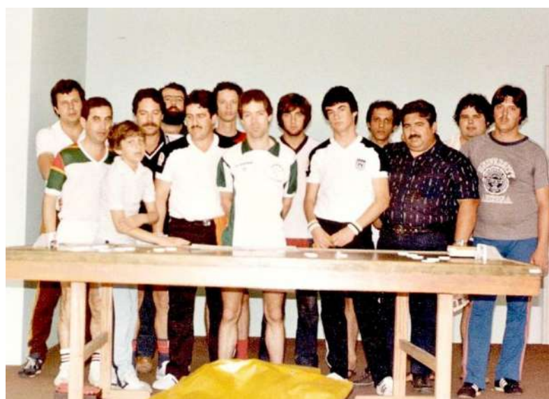
Participantes da 3ª Taça RS

A 3ª Taça RS (na época chamada de Torneio dos Campeões), foi disputada em Porto Alegre, na sede da AFUMEPA, no Centro Comercial Independência.