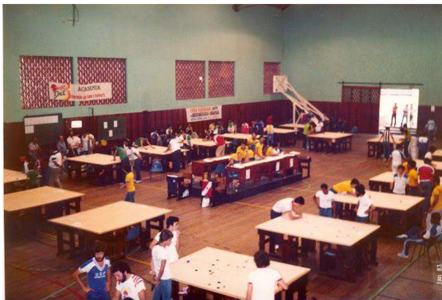
Panorâmica do ginásio da Academia do Comércio, de Juiz de Fora (MG), sede do campeonato