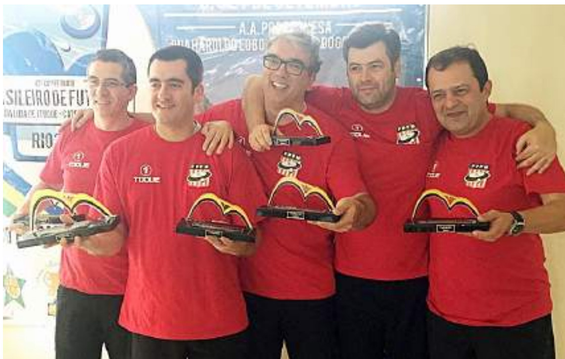
Seleção de São Paulo

O Rio Grande do Sul ficou em terceiro, Santa Catarina em quarto e Paraná em quinto.