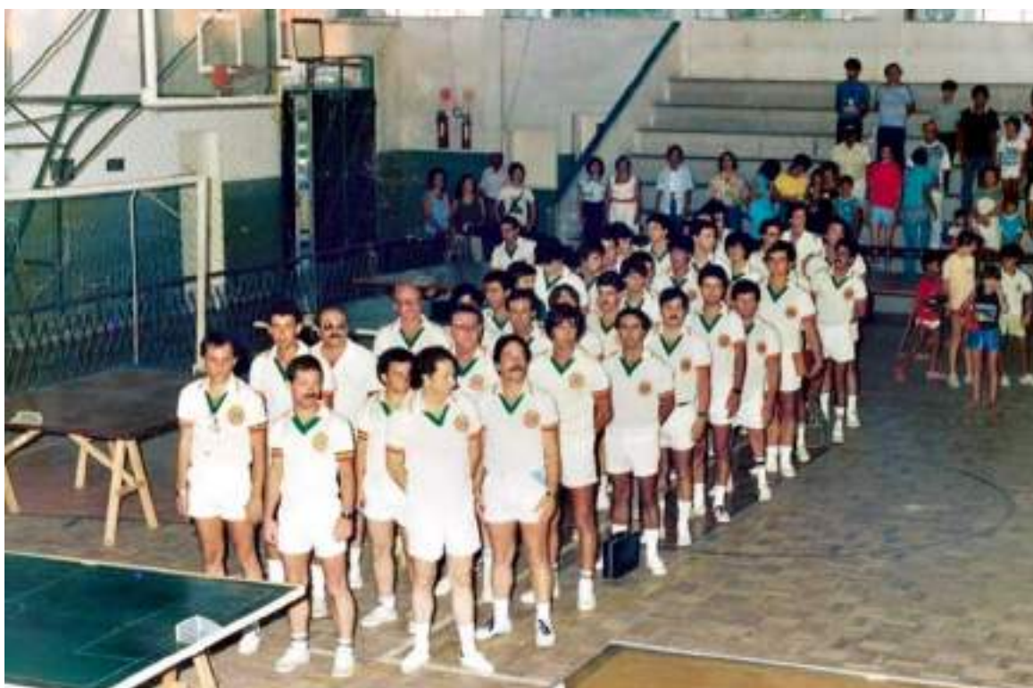
Delegação gaúcha no Brasileiro: oito técnicos entre os dez primeiros colocados

Inscreveram-se 80 (três faltaram) técnicos de 9 Estados do Brasil.