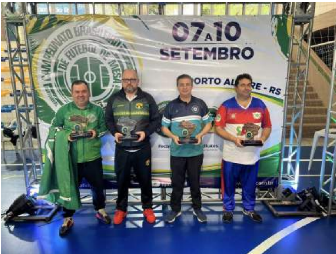
Taça Brasil Senior