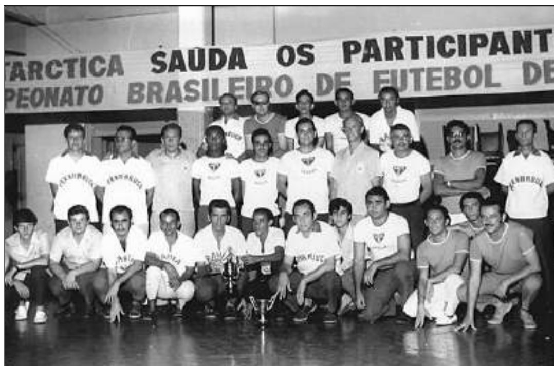
Todas as delegações