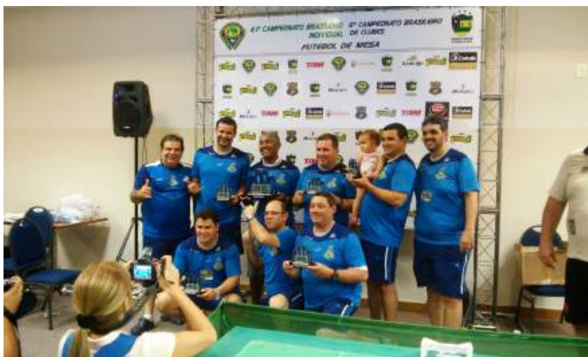
Equipe da ACRA