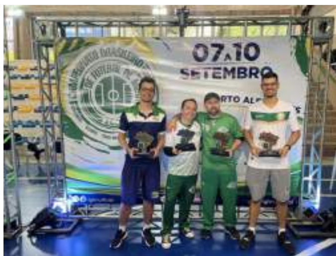
Pódio da Taça Brasil Adulto