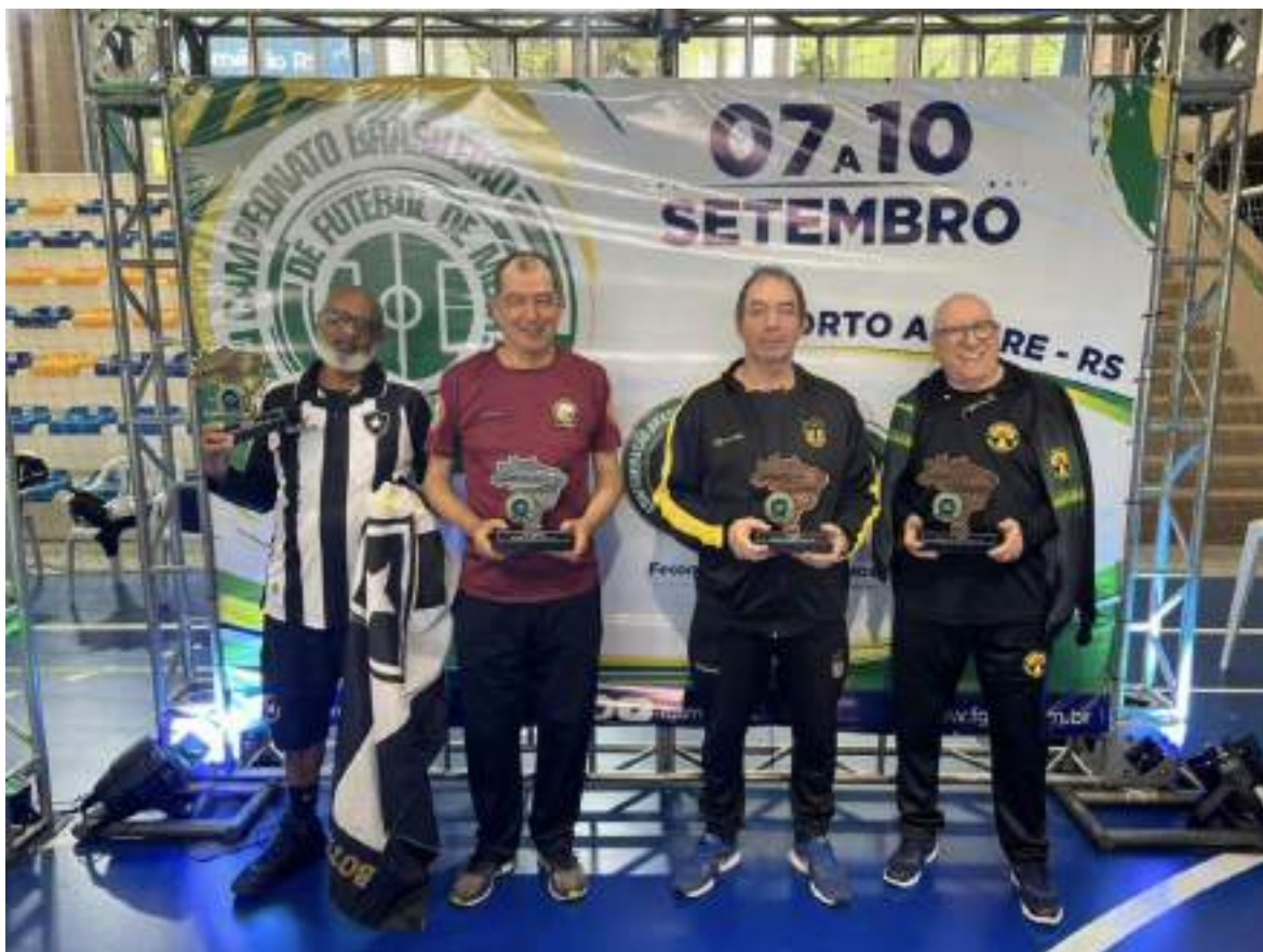
Taça Brasil Master