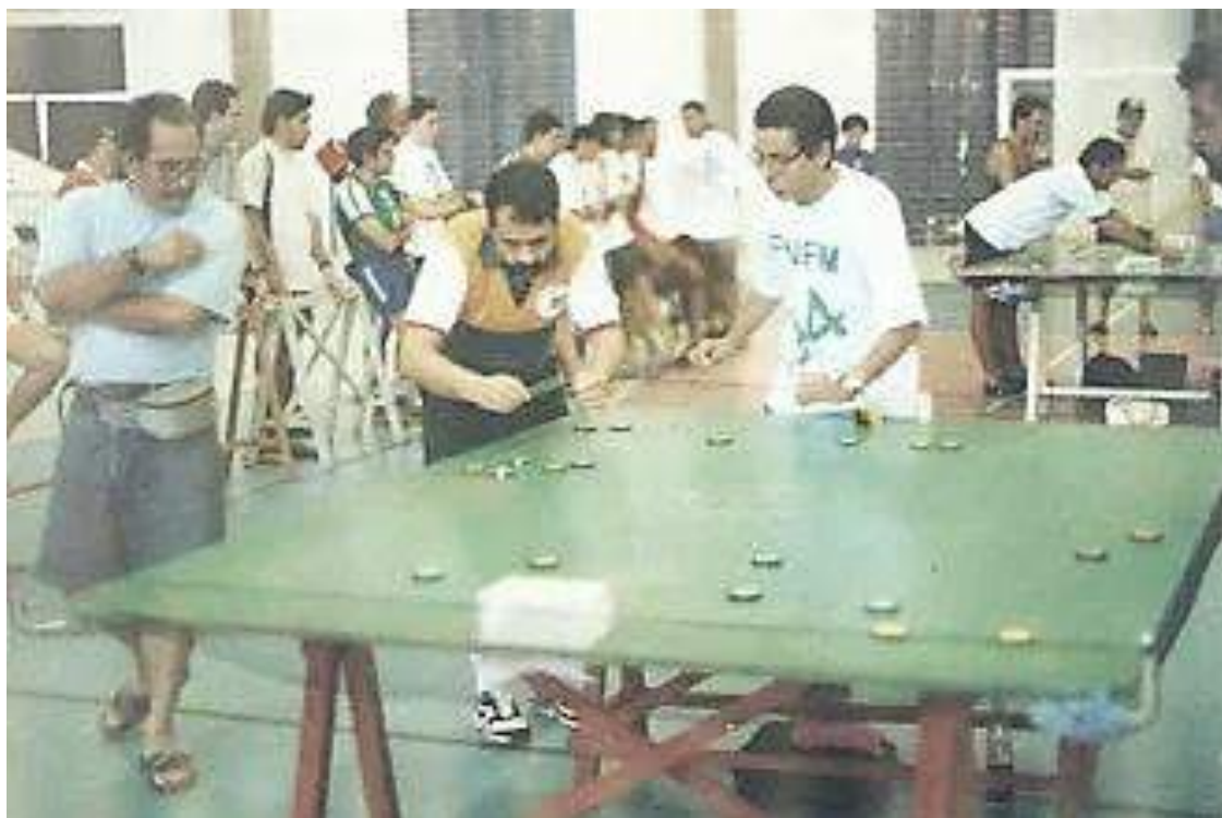
Final: Guido x Franklin

A campanha do campeão Guido foi a seguinte: nove jogos, com seis vitórias e três empates. Marcou 15 gols e sofreu apenas um. Os resultados foram estes: 7 x 0 André-SE, 1 x 0 Romeiro-RN, 2 x 0 Derocy-RN, 1 x 1 Fabiano-RN, 0 x 0 Pedro Neto-RN, 1 x 0 Pedro Neto-RN, 1 x 0 César-RN, 2 x 0 Pimentel-BA e 0 x 0 Franklin-RN (decisão nos pênaltis à distância: Guido 1 x 0).