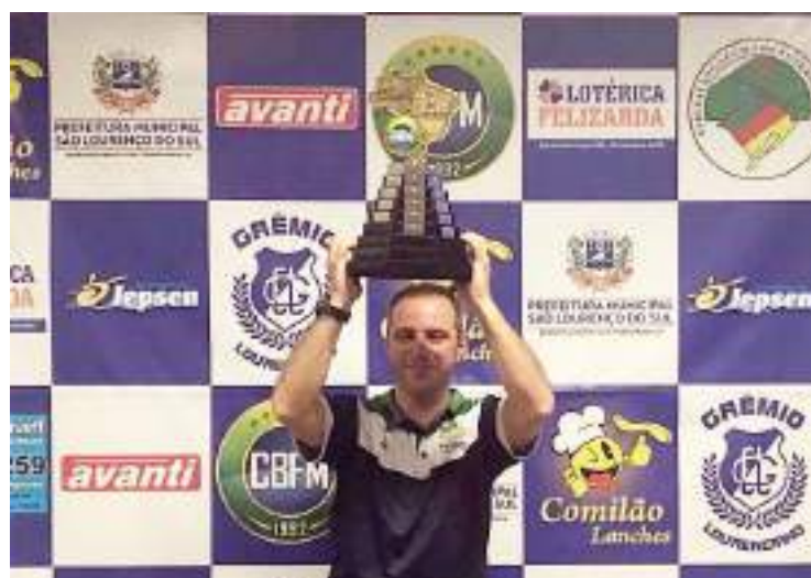
O campeão da Especial Moisés da Costa

4º Lugar: Portoalegrense / Porto Alegre - RS